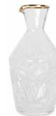
Karaff Holiday HM Home