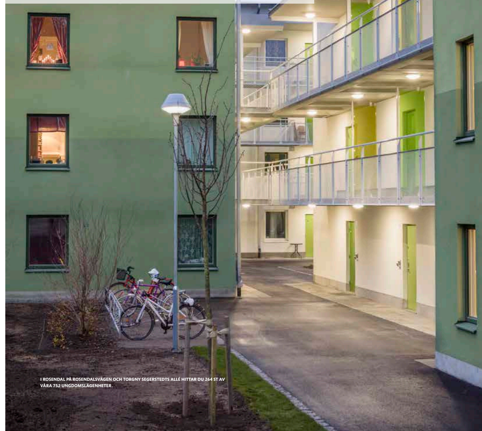
I ROSENDAL PÅ ROSENDALSVÄGEN OCH TORGNV SEGERSTEDTS ALLÉ HITTAR DU 264 ST AV VÅRA 752 UNGDOMSLÄGENHETER.

dotter är nitton har hon vissa fördelar på bostadsmarknaden. Hon kan hyra en ungdomslägenhet, de har man rätt att hyra tills man är 26 år. Skulle det även vara så att hon börjar plugga så öppnas även utbudet av studentlägenheter upp sig.