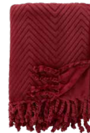
Pläd HM home