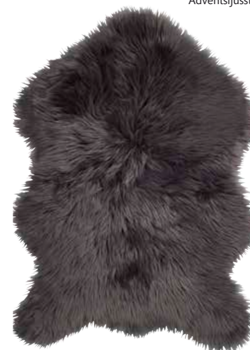
Färskinn (konstgjort) Jysk