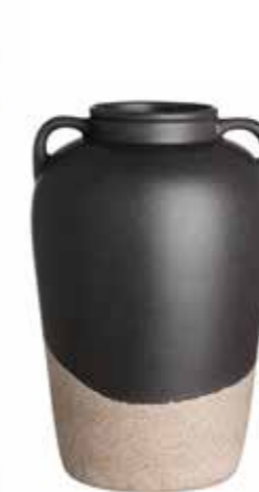
Vas, stengods, HM home