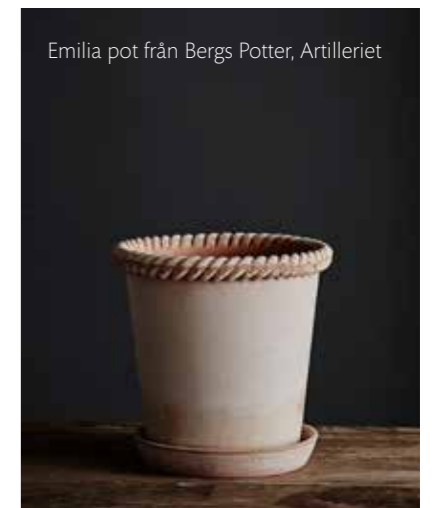
Emilia pot från Bergs Potter, Artilleriet