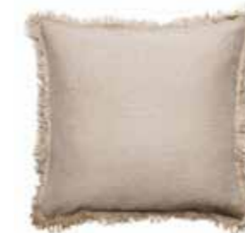
Merlin natural 50x50 cm, Himla