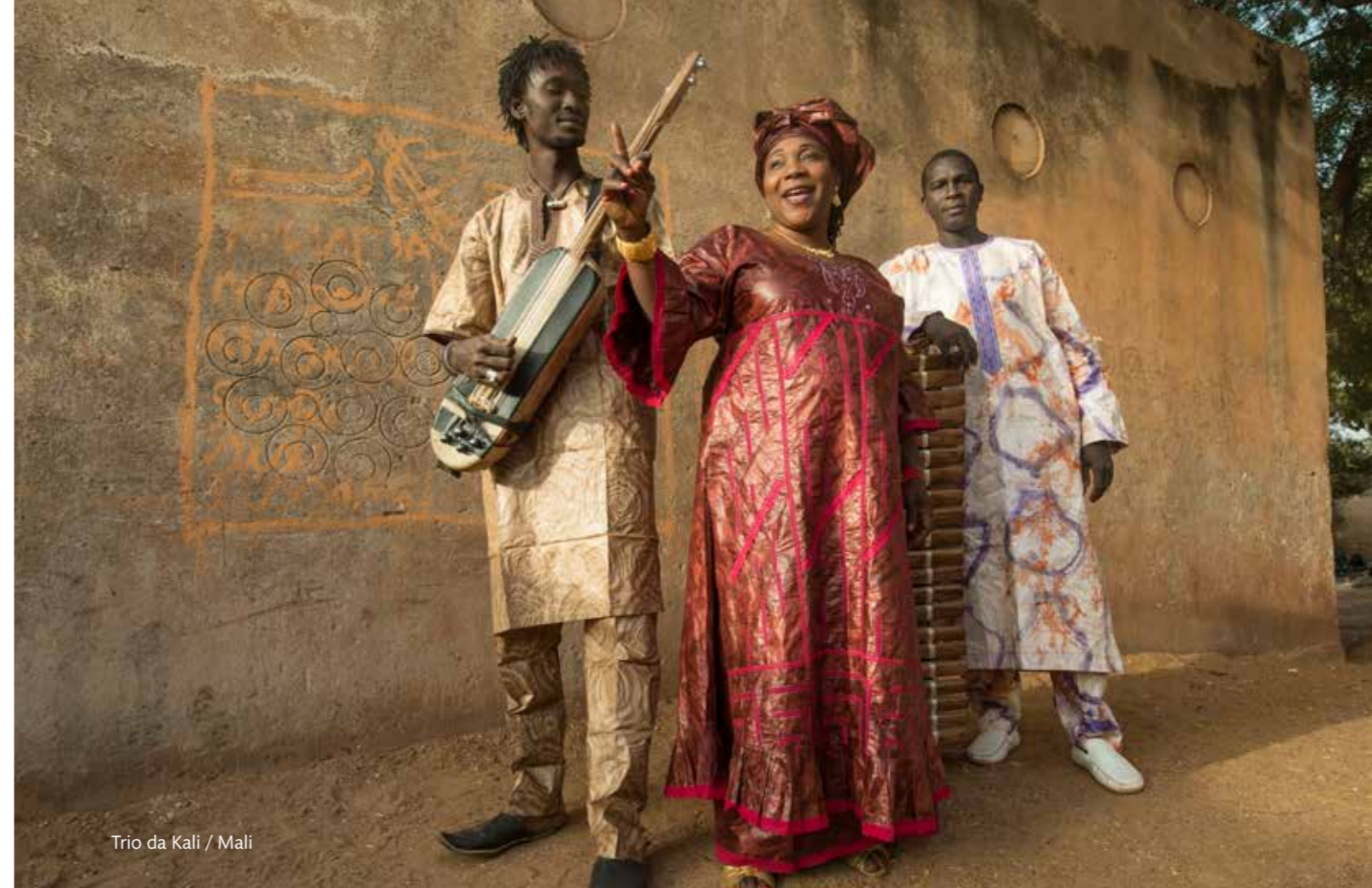
Trio da Kali / Mali