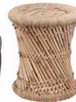
Pall, bambu-jute, Granit