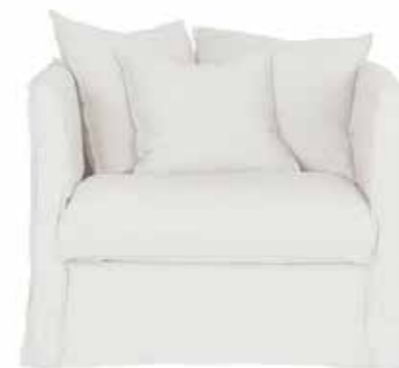
Fätölj Luna från Ellos Home