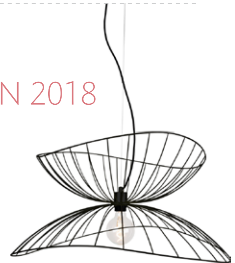
Taklampan Ray, EM home

VILL DU FÅ FLER TIPS FRÅN BOBUTIKEN? Välkommen in till S:t Persgatan 28. I Bobutiken kan du även boka vår inredningshjälp - första 30 min är kostnadsfritt, därefter debiterar vi 595 kr per timme. Vi ses!