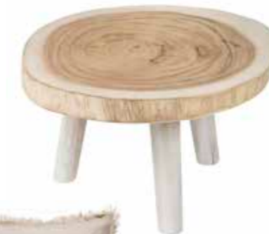
Litet bord från Granit