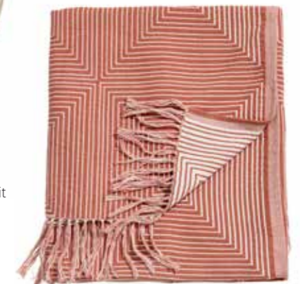
Pläd, roströd, HM home