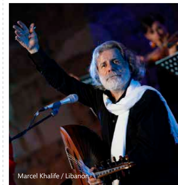
Marcel Khalife / Libanon