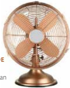
NÄST BÄSTA BORDSFLÄKT ENLIGT HEM & HYRA, FRÅN CLAES OHLSON, 399 KR.

Uppsalahems kö flyttar till Uppsala bostadsförmedling den 1 juni! Läs mer på: www.bostad.upsala.se