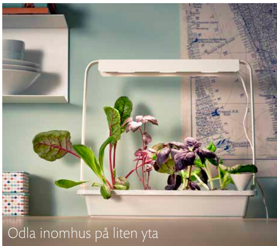
Odla inomhus på liten yta

GENOM ATT ODLA I VATTEN istället för i jord, tillföra näringsämnen och ljus går det alldeles utmärkt att odla inomhus även på små utrymmen. IKEA har tagit fram produkter med