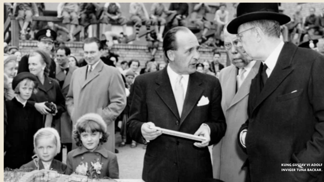
KUNG GUSTAV VI ADOLF INVIGER TUNA BACKAR.

För Uppsalahem innebär beslutet att bland annat stadsdelarna Gränby och Valsätra byggs under kommande årtionde med totalt 2100 lägenheter.