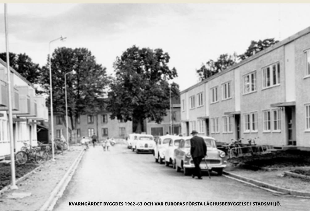
KVARGÄRDET BYGGDES 1962-63 OCH VAR EUROPAS FÖRSTA LÅGHUSBEBYGGELSE I STADSMILJÖ.

Bostadsbristen är besvärlig i stora delar av Sverige under efterkrigsåren. Inflyttningen till Uppsala är stor, industrierna och Försvarsmakten behöver mycket folk och många av de bostäder som finns är undermåliga. För att få i gång byggandet av hyresrätter skapas förmånliga finansieringsmöjligheter för allmännyttiga bostadsbolag.