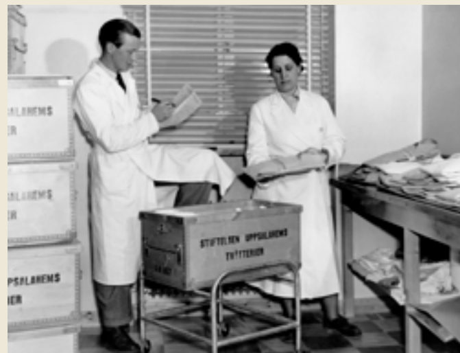
INNAN 50-TALET VAR DET VANLIGT ATT LÄMNA IN SIN TVÄTT PÅ TVÄTTERI.