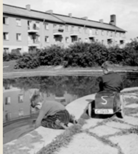
VÅRT FÖRSTA OMRÅDE LASSEBY GÄRDE.

"Kattorna är den största plågan, de utför sina behov i barnens sandlådor, i trappuppgångar, på gångbanor, katter som hoppar in genom fönster i bottenvåningarna där de förorenar, river sönder mattor och gardiner, katter som använder barnvagnar som sovpåsar. Lekande barn som söla ner sina händer och kläder med kattexkrementer. Påträffas katt inom område kommer den omhändertagas."