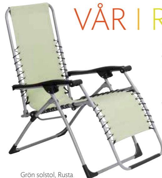
Grön solstol, Rusta