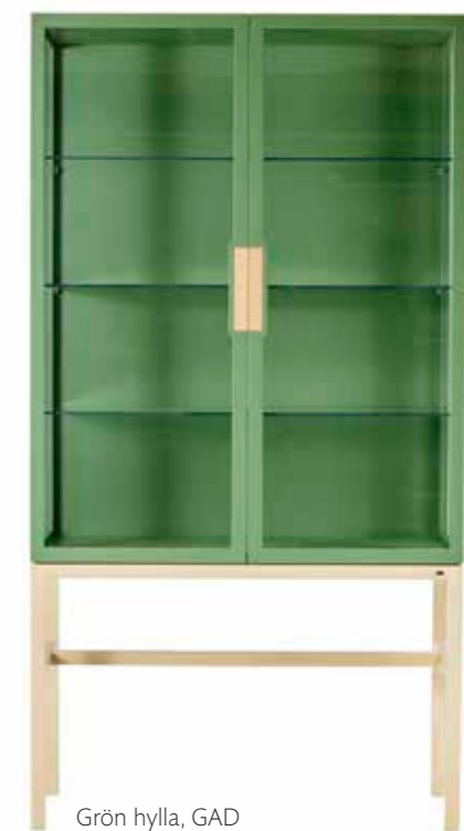
Grön hylla, GAD