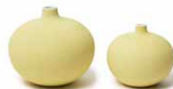
Gula vaser, Lindform