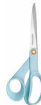
Ljusblå sax, Fiskars