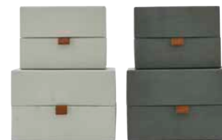
Gröna pappådor för förvaring, House doctor