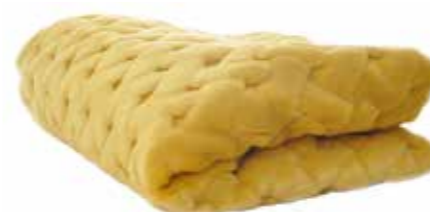
Gul sammetspläd, Ceannis