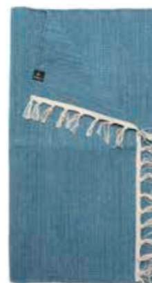
Blå matta i bomull, Himla