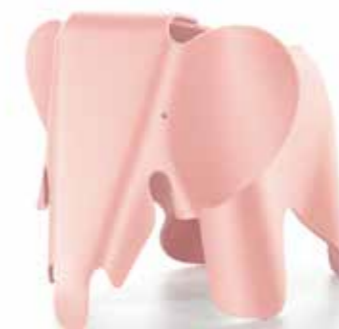
Rosa elefant, Eames