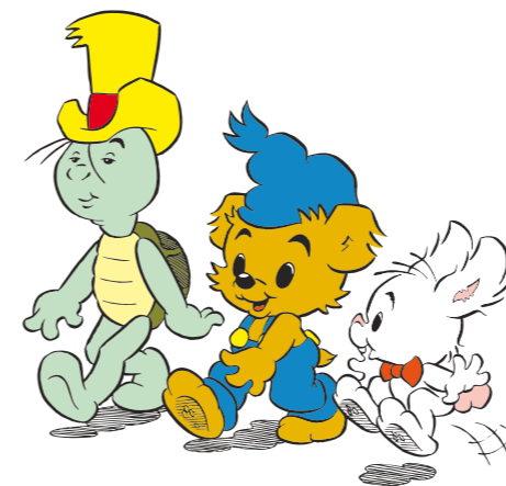
Bamse och Dundermysteriet är producerad av Arbetsmuseum i samarbete med BAMSE Förlaget, Egmont Kärrnan Bamseredaktionen, Kolmårdens Djurpark, Hyresbostäder samt Sparbankstiftelsen.

Ganska snart förstår de att något är fel med miljön och misstänker att det är Krösus Sorks fabrik som orsakar problemen. Fabriken finns på Klippön, och Bamse, Nalle-Maja och deras vänner tar oss med på en resa för att lösa mysteriet.