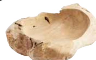
Skål i trä, Muubs