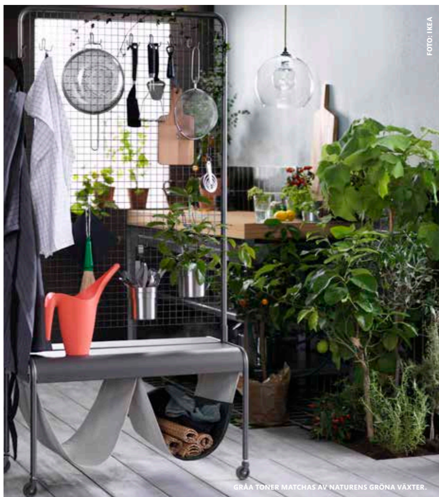
GRÅA TONER MATCHAS AV NATURENS GRÖNA VÄXTER.

Skulle du inte kunna komma den 16:e september får du i nästa nr av Hemlängtan ta del av bilder och tips från visningslägenhetens inredning.