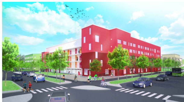
Vy från Rosendalsvägen & Torgny Segerstedts Allé